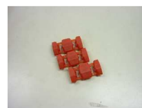
ルームランプ接続用