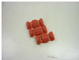
ルームランプ接続用