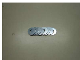
調整用スペーサー