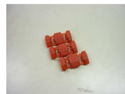
ルームランプ接続用