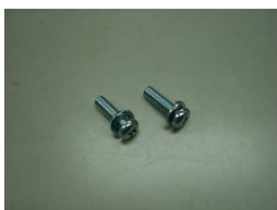
M6X20 ボルト&ワッシャー