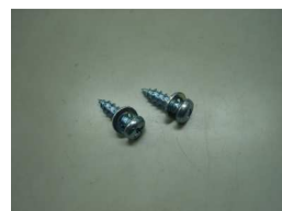
M6 タッピング&ワッシャ