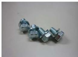
M6X10 ボルト&ワッシャー