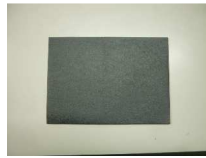
クッションテープ