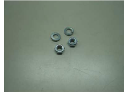
M6 ナット&ワッシャー