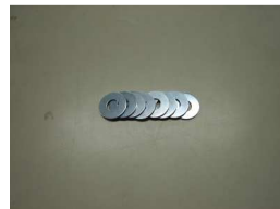
隙間調整ワッシャー