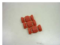
ルームランプ接続用