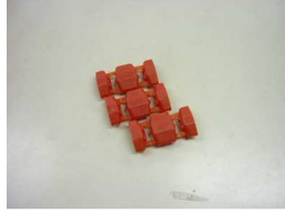
ルームランプ接続用