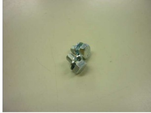
M6X10 ボルト&ワッシャー